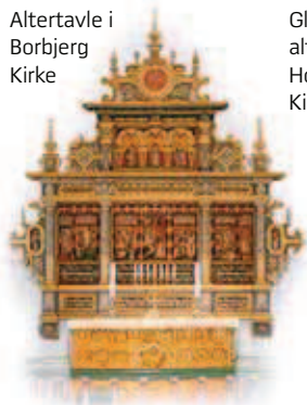
Altertavle i Borbjerg Kirke