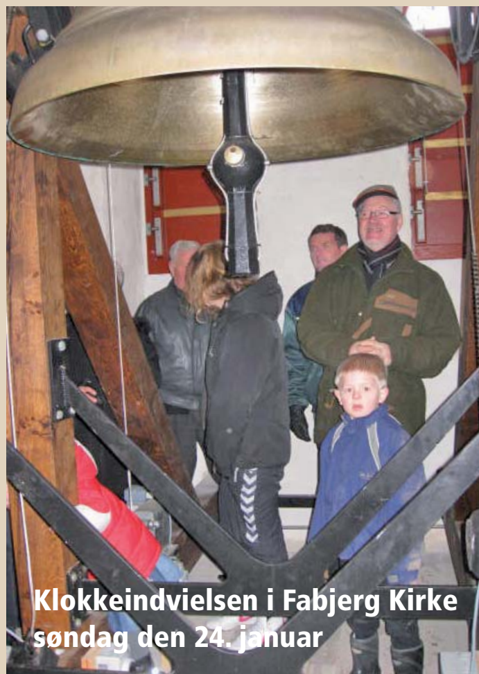
Klokkeindvielsen i Fabjerg Kirke søndag den 24. januar